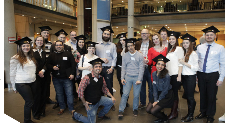
Design: SCHWIND/Agentur für Zukunftskommunikation

Der Garantiefonds Hochschule der Otto Benecke Stiftung e.V.